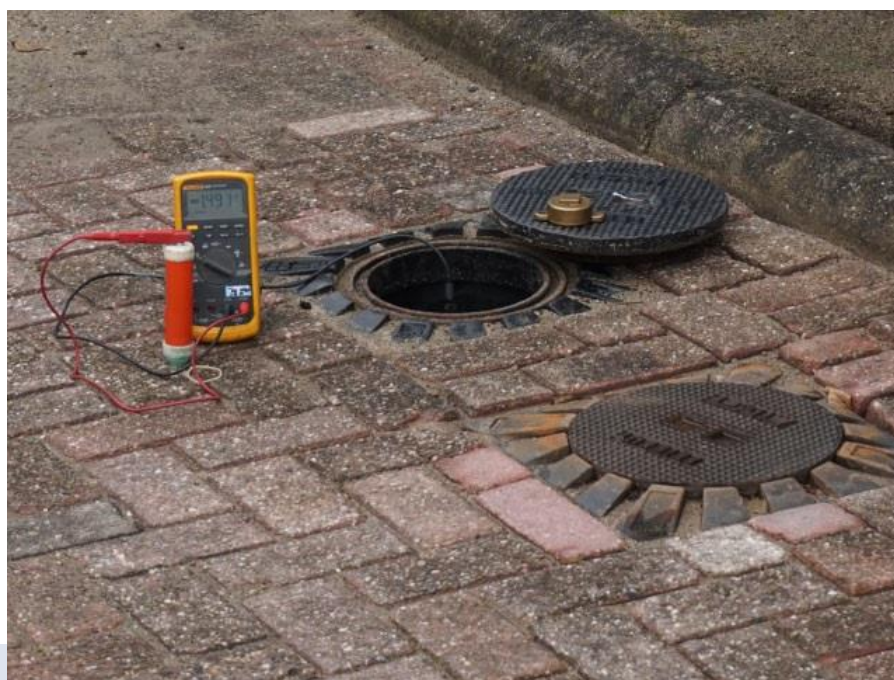
Voorbeeld van een Kb-meting.

De inspecteur plaatst bij het vaststellen van de MEP-in en de MEP-uit de \text{CuCuSO}_4 -referentiecel altijd zo dicht mogelijk boven de tank, in een vochtige bodem die aan het maaiveld visueel niet is verontreinigd met bijvoorbeeld morsproduct.